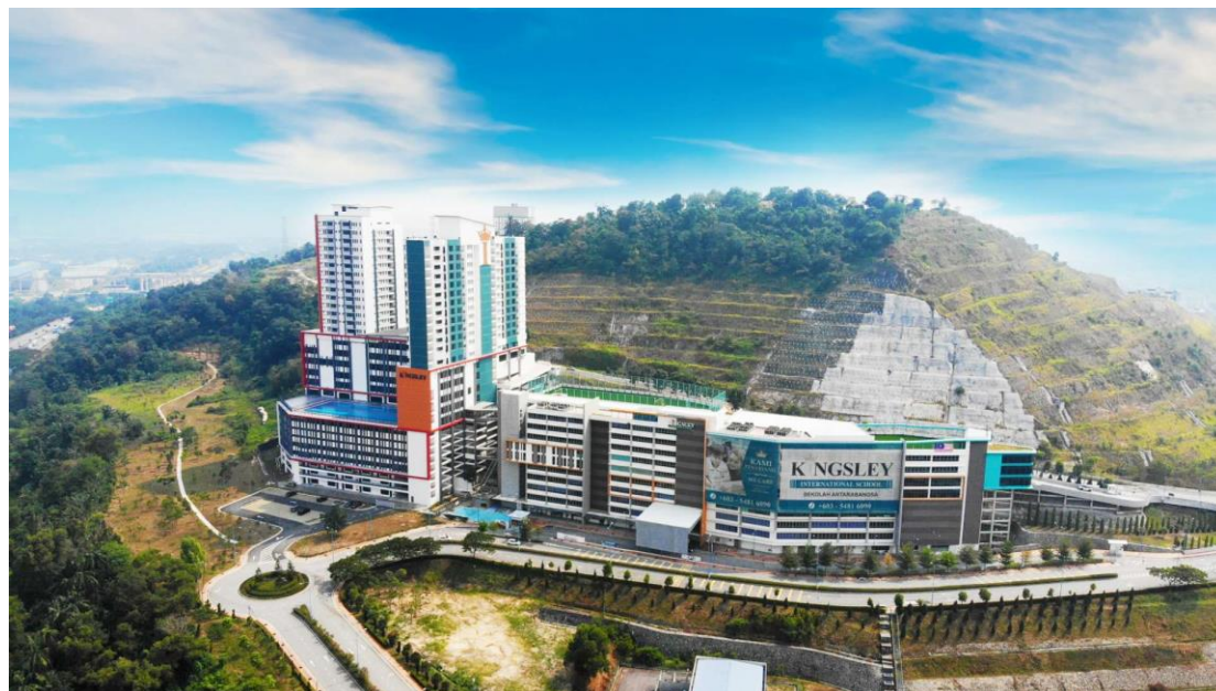
位于马来西亚吉隆坡的皇昱校舍

方米，其中一栋是 10 层高的建筑物，另一栋是分别为 13 层和 15 层的双塔综合楼。学校拥有的先进设施包括一个设备齐全的餐厅，一个室内游泳池，一个奥林匹克标准的室外游泳池，两个图书馆，一个体育馆以及几个多功能室和礼堂。宿舍面积为 49,518 平方米，可容纳 800 多名寄宿学生。这些资产目前的估值超过 4 亿港元。