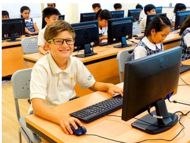
皇崑学生在电脑室学校情况

如果皇崑 (Kingsley) 股东接受要約的提议，枫叶集团将通过为来自马来西亚，新加坡及其他东南亚国家的学生提供优质国际 K-12 教育来优先提升盈利能力。除了当前的 A-Level 课程和其他高中高阶课程之外，我们还将加入与中国孔子学院 (汉办)联合开发及批准的枫叶汉语课程 (CSL)。除了 K-12 教育外，皇崑目前还提供一些高等教育服务，枫叶集团打算取消该等服务。